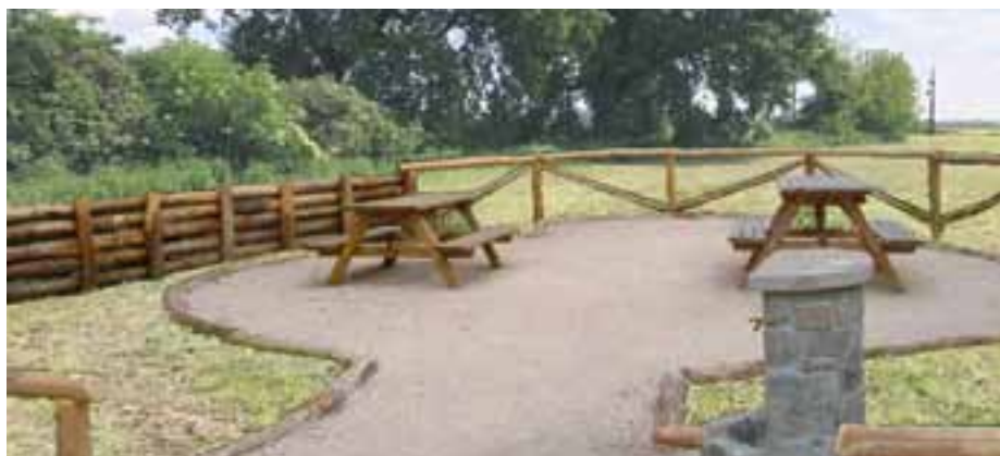
Progetto nuova Pista Ciclabile Mombretto

Realizzazione Progetto nuova Pista Ciclabile Mombretto - San Martino