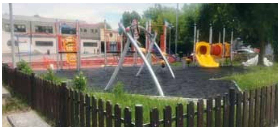
Parco piazza Terracini Mombretto

Nuova area cani via Monti Mombretto importo pari ad € 41.095,11