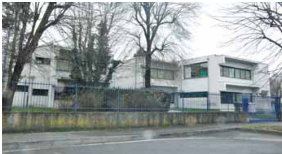
Scuola primaria Bustighera

Sicurezza negli edifici: Controsoffitti antisfondellamento Scuola Primaria e Secondaria di BUSTIGHERA importo pari ad € 48.770,08