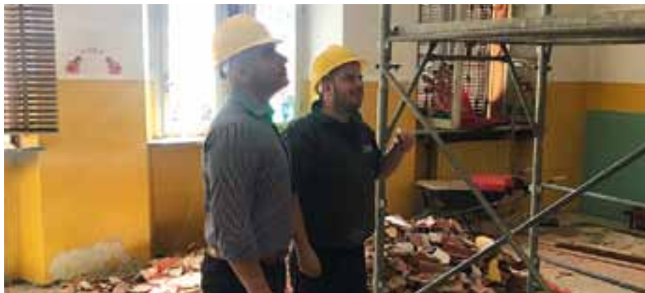
Centro Civico San Martino Olearo

Messa in sicurezza sede Comunale e Centro Civico San Martino Olearo importo pari ad € 85.791,30