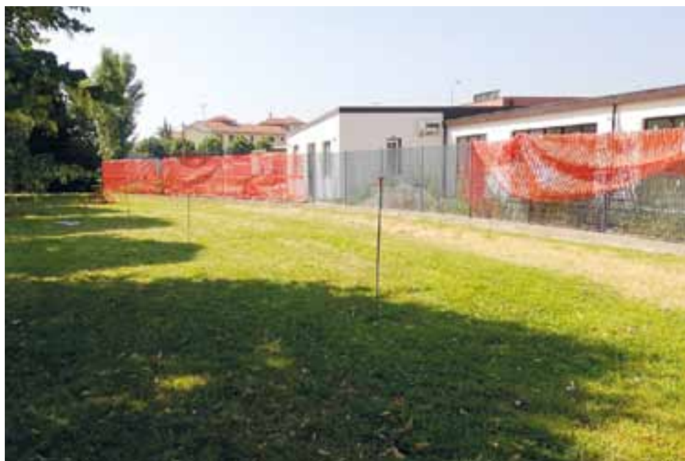
Scuola secondaria Bettolino